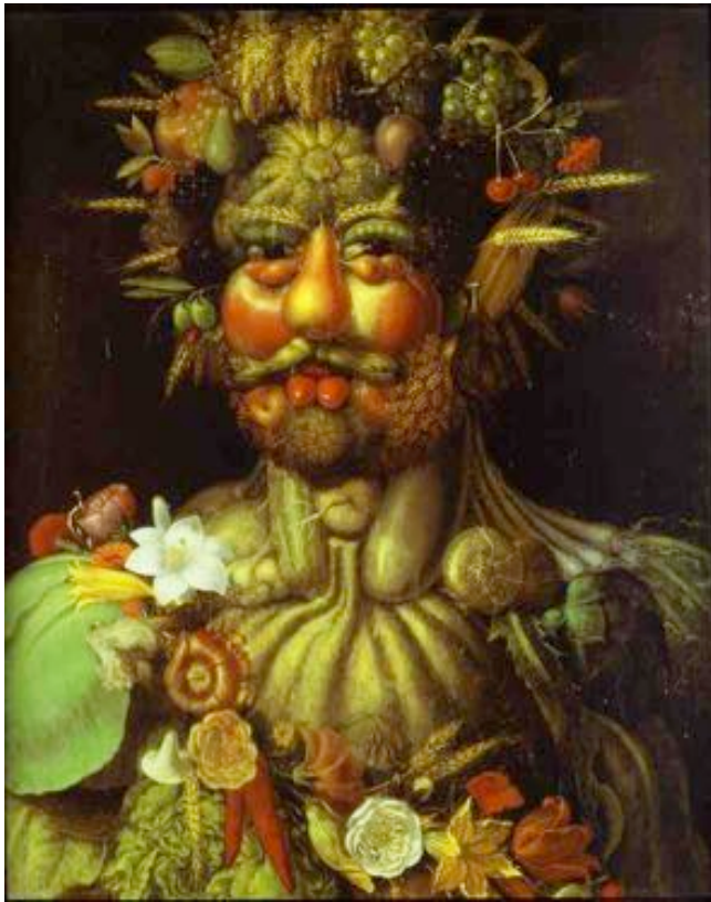
Arcimboldo, vers 1590