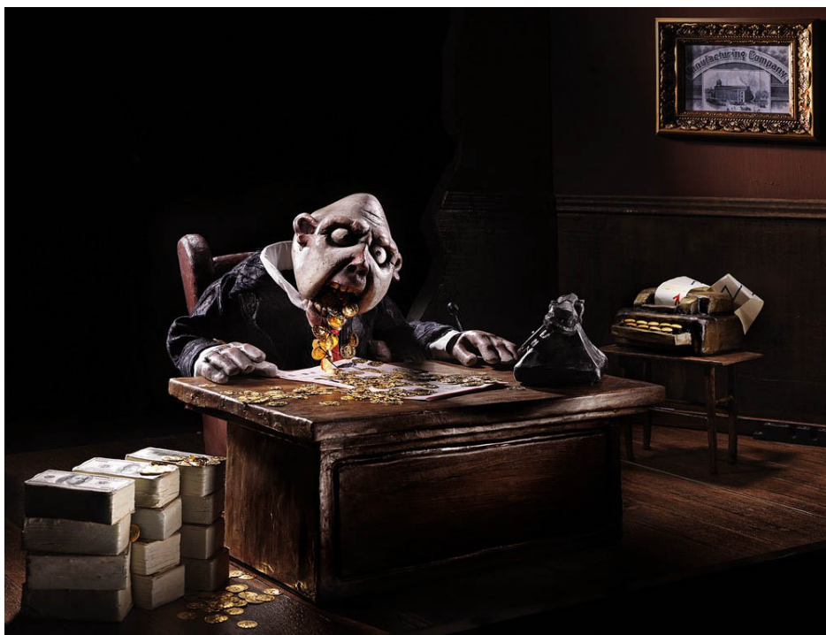
Marionnettes du Merlin PuppetTheatre

Leur fonction ne se limitera pas à de la construction et de la technique : je les envisage au contraire comme des créateurs, des collaborateurs capables de porter un regard expérimenté sur la création du spectacle.