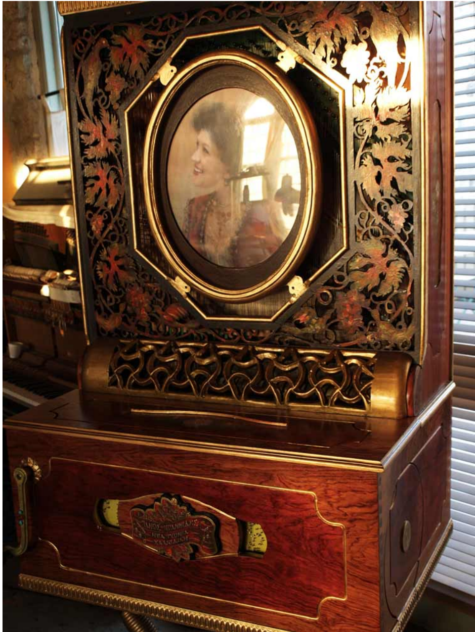
Lantern fabriqu e par Panos Ioannidis, dernier fabricant install e   Thessalonique